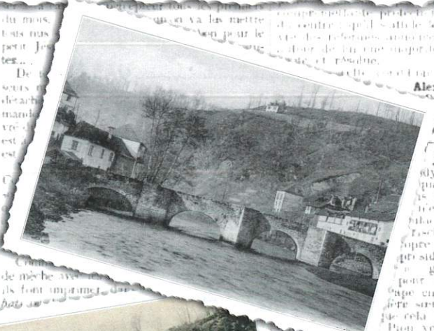
Le pont de la Grande Rue - Vigeois

C'est une histoire du Père, Du Fils, On ne peut contester qu'elle ne soit dans une figure étrange, anti-paternelle, mais carac- térisée par l'absence de la mère, de plus, con- stantement, impregnée de religiosité, plus que