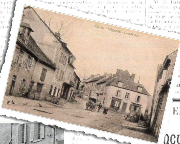
Centre Vigeois - Grande Rue

L'Action publiera demain les articles de CHARLES DUMONT et de D r MESLIER